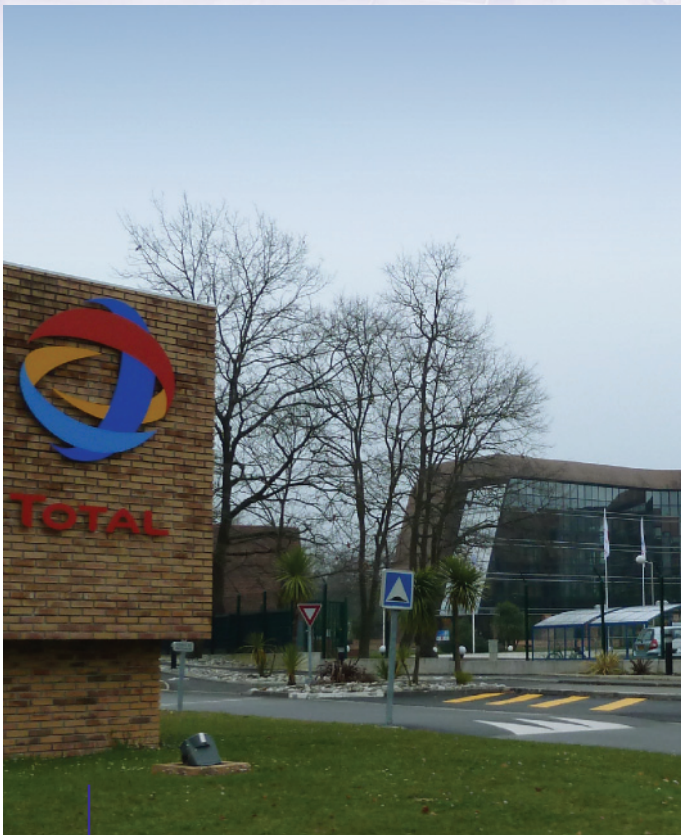
Centre Scientifique et Technique Jean-Féger à Pau

La note 19 de l'Observatoire illustre, au travers de l'exemple de l'Agglomération Pau-Pyrénées, l'intérêt des données relatives à l'emploi tant dans le cadre d'un diagnostic économique que dans la mise en place d'un tableau de bord économique. ■